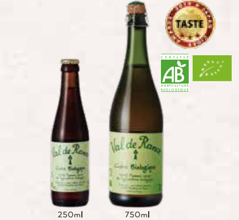
シードル ヴァルドランス

JAN:3271470750222 / 入り数:12 / 750ml JAN:4540656000178 / 入り数:24 / 250ml