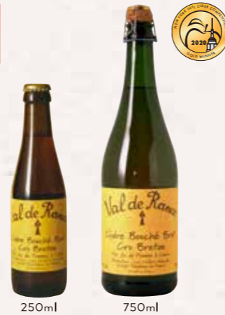
シードル ヴァルドランス

クリュブルトン〈辛口〉 Cidre Val de Rance Cru Breton Brut アルコール分：5~6%