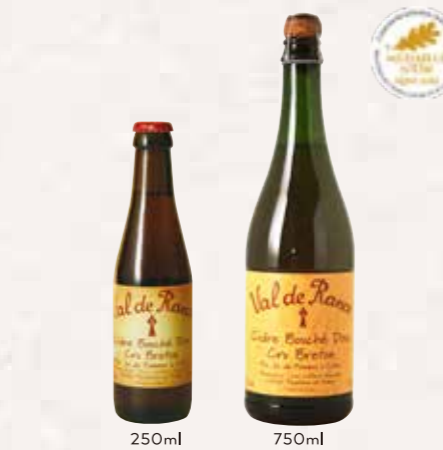
シードル ヴァルドランス

JAN:3271470750215 / 入り数:12 / 750ml JAN:4540656000017 / 入り数:24 / 250ml